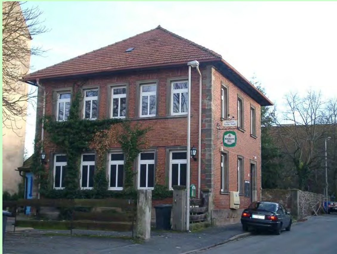
Jugendclub Frauenaurach: Brandschutzmaßnahmen und Einbau Ölzentralheizung Bauzeit: 4/2011 bis 7/2011 Kosten: 60.000 Euro