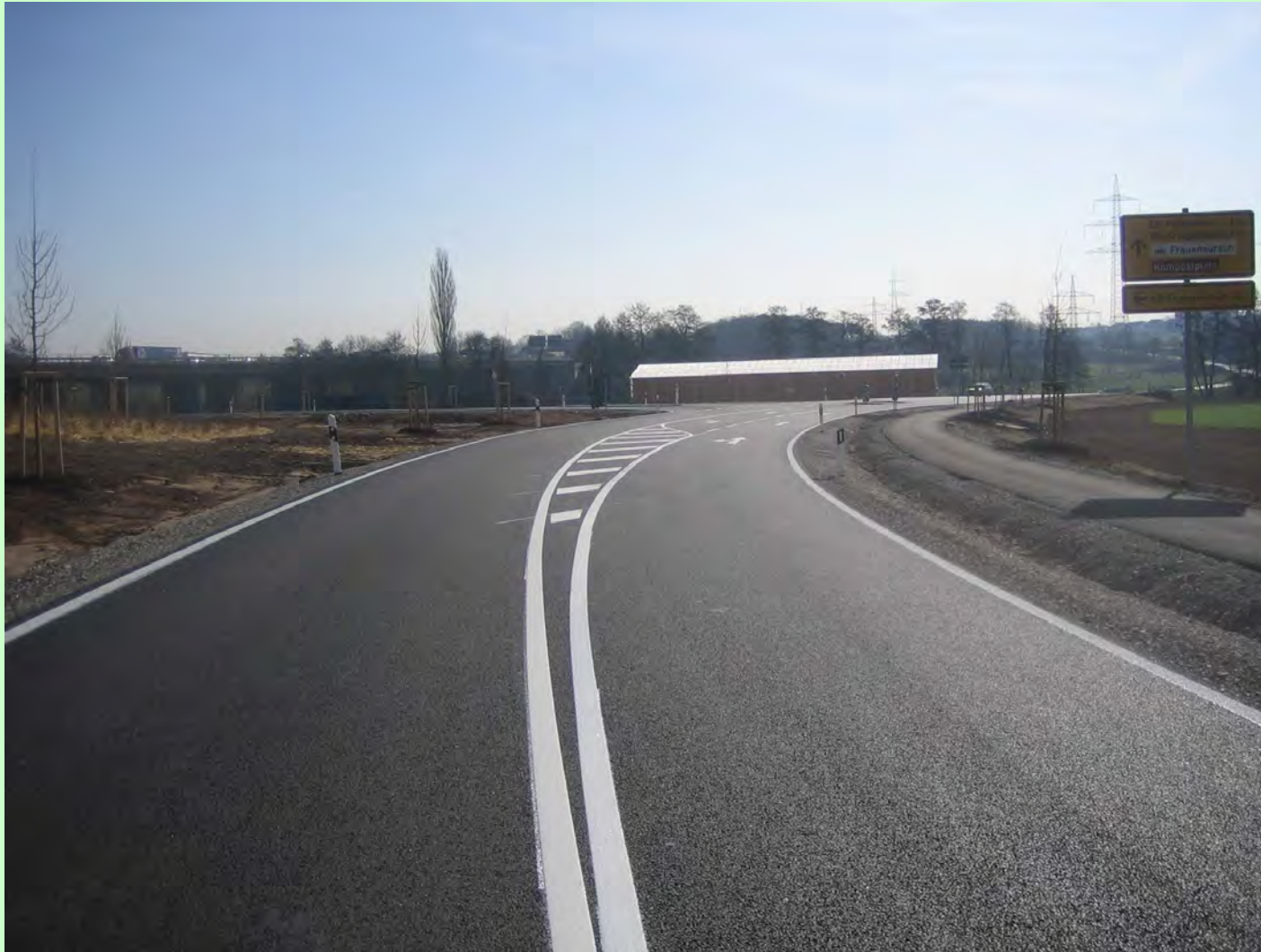
Herzogenauracher Straße einschl. Pappenheimer Straße : Umbau und Asphaltdeckenerneuerung Bauzeit: 2010 bis 2012 Kosten: 802.500 Euro