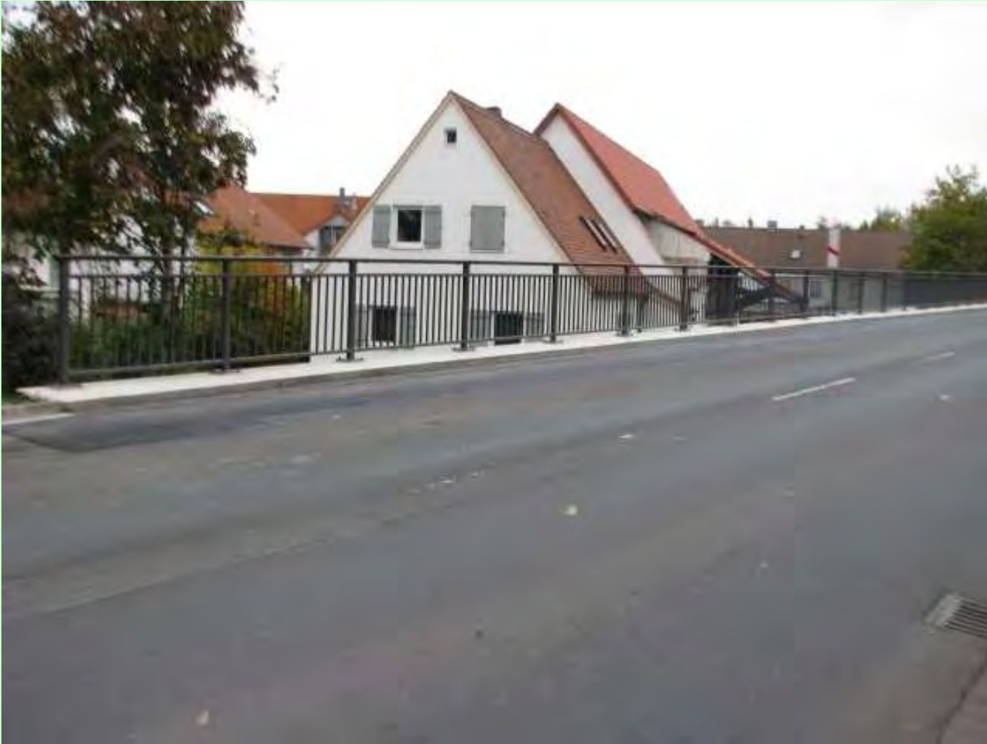
Sylvaniasstraße, Brücke über MD-Kanal: Fahrbahndeckensanierung, Sanierung der Stützmauer Bauzeit: zwischen 3/2011 bis 6/2012 Kosten: 560.000 Euro