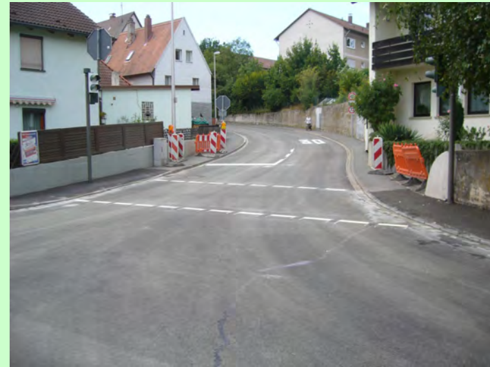
Erlanger-, Brücken- Herzogenaauracher- und Karl-May-Straße: Fahrbahnsanierung Bauzeit: 7/2012 bis 8/2012 Kosten: 110.000 Euro