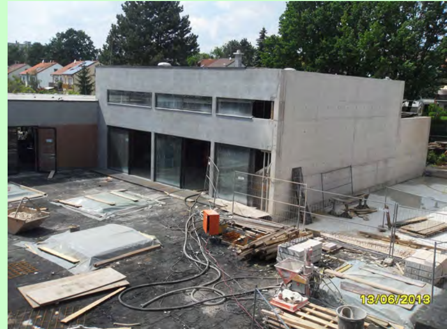
Krippe Frauenaurach: Umbaumaßnahmen mit Generalsanierung Bauzeit: 5/2012 bis 8/2013 Kosten: 4.325.000 Euro