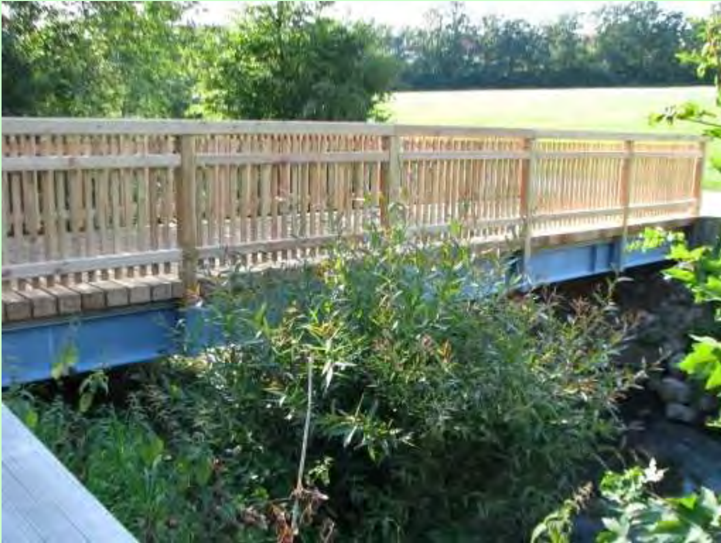
Fußgängerstegwestlich des MD-Kanals: Überbauerneuerung Bauzeit: 7/2009 Kosten: 17.000 Euro